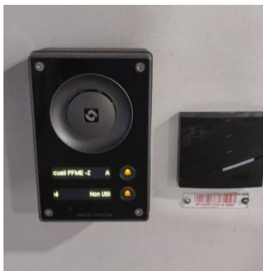
4/ Sonnez à l'interphone sur votre gauche