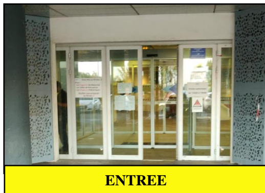
3/ Passez la première double porte