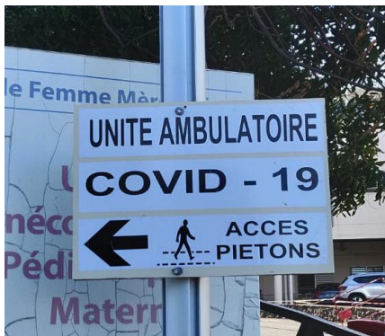
1 / Suivez les panneaux d'indication