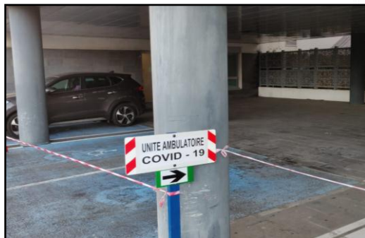
2 / Parking